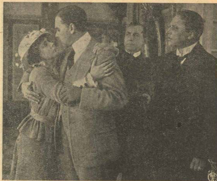
Kampen om Kvinden.